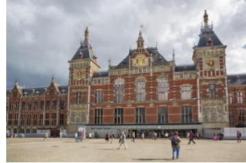
Centraal Station Amsterdam

Natuurlijk komen het Rijksmuseum en het Centraal Station aan de orde. Kasteel de Haar bij Haarzuilens wordt niet vergeten. Dit alles wordt van mooie beelden voorzien. Tenslotte probeer ik altijd wat gebouwen van Cuypers te vinden die in de buurt liggen van de plaats waar de presentatie plaats vindt. Het is geen wonder dat dit heel vaak lukt.