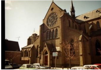
Sint Laurentiuskerk Alkmaar

Inderdaad zou na het herstel van de bisschoppelijke hiërarchie in 1853 de neogotiek snel de katholieke stijl bij uitstek worden. Alberdingk Thijms reclame voor Cuypers had tot gevolg dat de architect vanaf 1859 ook boven de grote rivieren ging bouwen, te beginnen met de Sint-Laurentiuskerk in Alkmaar.