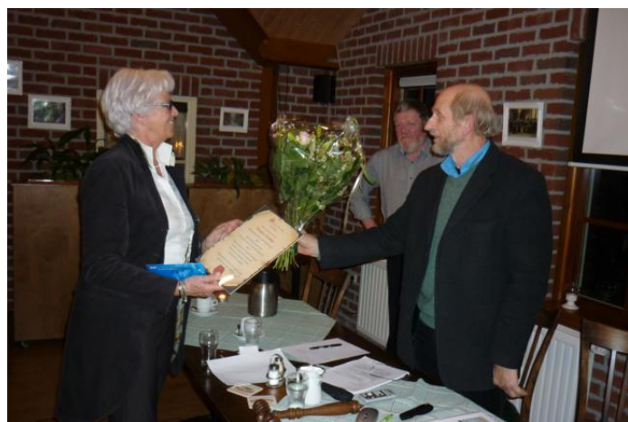
De aftredende voorzitter van de activiteitencommissie wordt onder luid applaus bedankt met oorkonde en bloemen