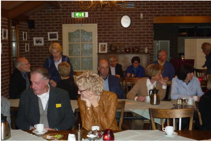
Even een pauze