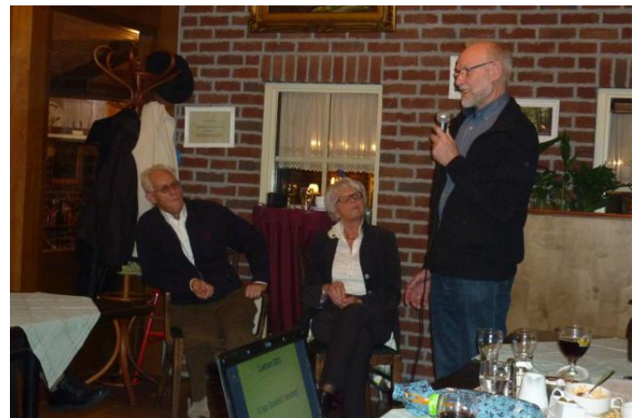
De voorzitter van de jubileumcommissie licht de plannen toe