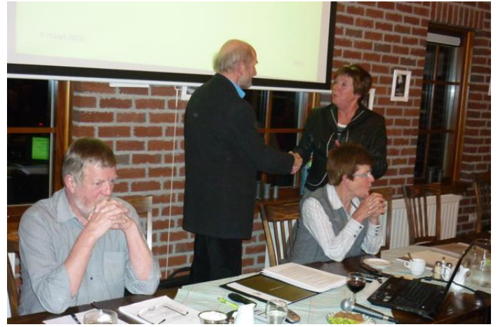
en dan wisseling van voorzitterschap bestuur