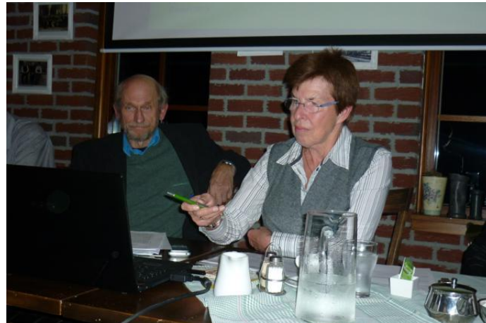
De penningmeester: Financieel jaarverslag en begroting