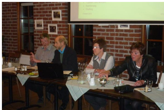
De secretaris: Jaarverslag